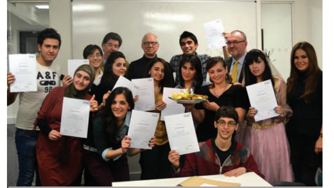
Londonla diplomların təqdimat mərasimində...

"British Council", "AccessBank" ilə əməkdaşlıq çərçivəsində, "Thomson Foundation" və Bakı Dövlət Universitetinin dəstəyi ilə həyata keçirilən "Yeni jurnalistlər nəslı" layihəsinin son mərhələsi Böyük Britaniyanın London şəhərində baş tutub. Layihə çərçivəsində keçirilən son treninqdə 10 nəfər tələbə iştirak edib. "Thomson